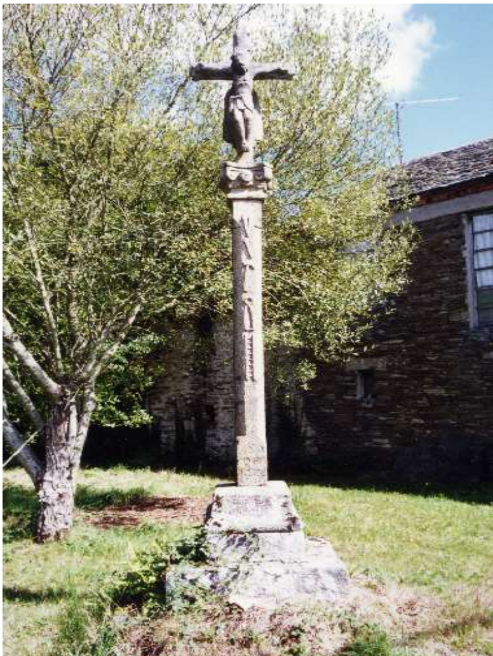
FOTO 7. CRUCEIRO DO CHAIRO. CASTRO DE RIBEIRAS DE LEA