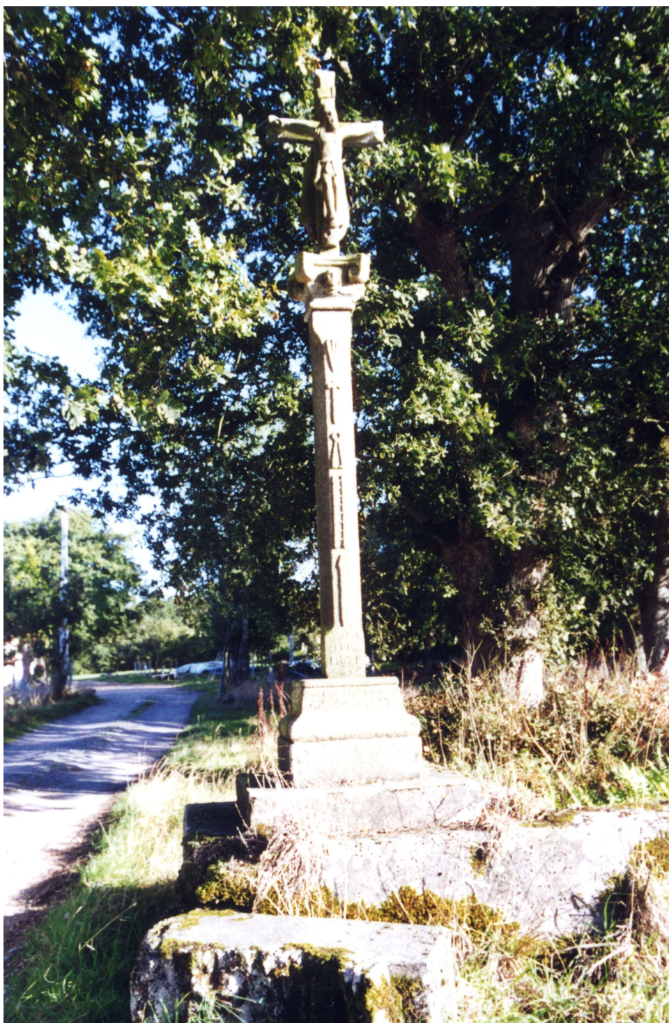
FOTO 3. CRUCEIRO DE BELOI. SAN XIAO DE MOS