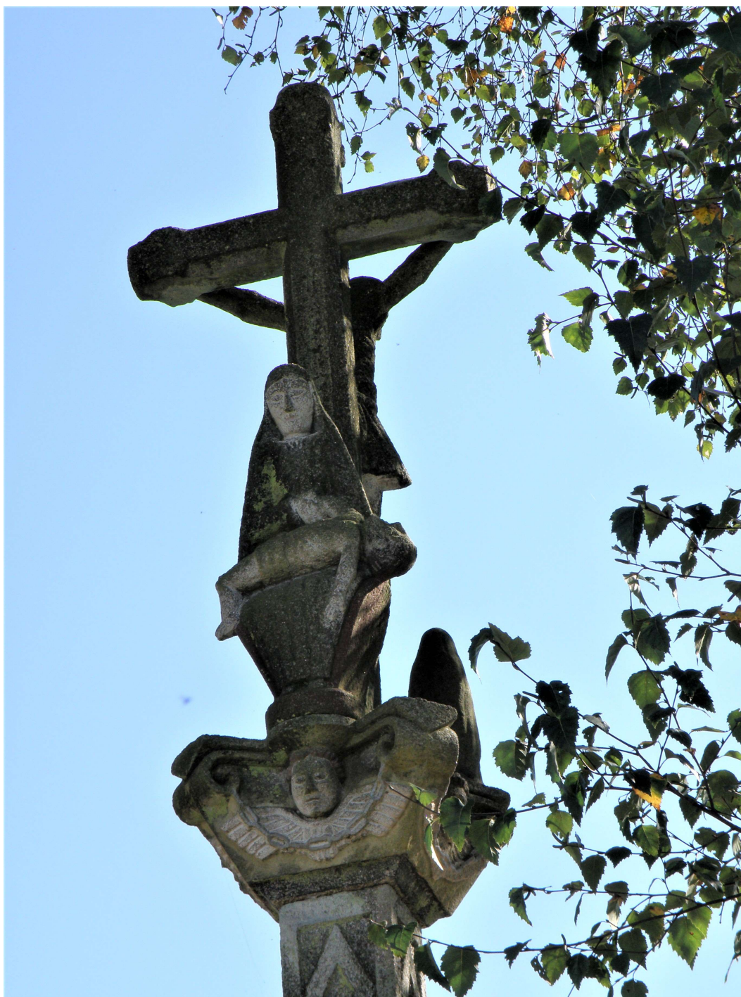
FOTO 16. CRUCEIRO DE RIBAS DE MIÑO (OUTEIRO). A VIRXE COMO PIEDADE.