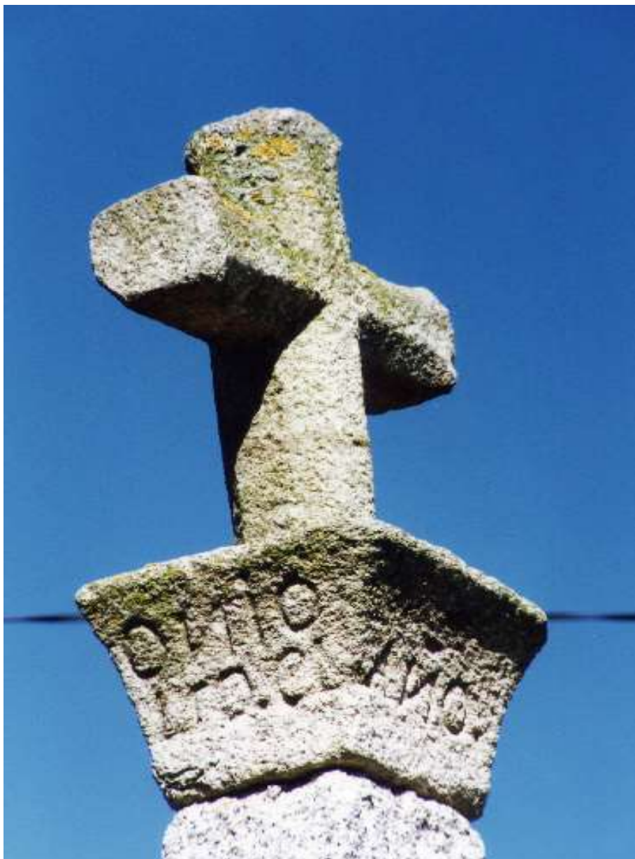
FOTO 17. CRUCEIRO DE LUDRIO. CRUZ.