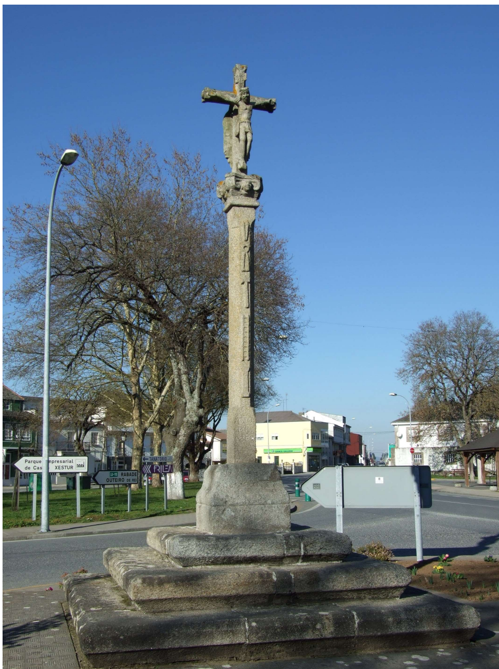
FOTO 6. CRUCEIRO DO CAMPO DA FEIRA. CASTRO DE RIBERAS DE LEA