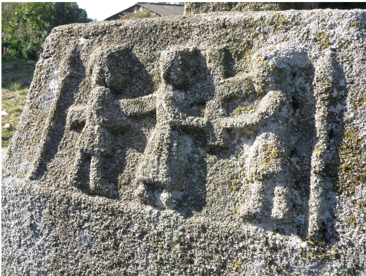
FOTO 10. CRUCEIRO DE VILAMEL. DETALLE DA BASE.